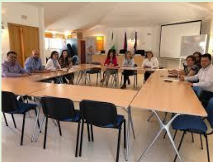
Intermediación laboral Bolsa de empleo