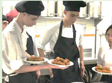
Formación Ocupacional Prácticas en empresas